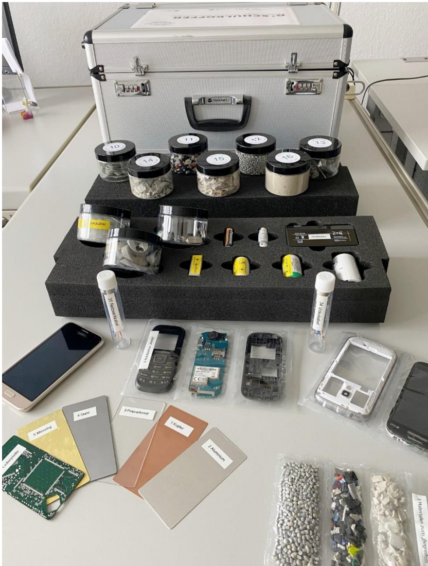
Blick in den Elektrokoffer

Ort: bei Ihnen vor Ort (Schule, Einrichtung) oder bei der Stadtreinigung Leipzig, Geithainer Straße 60