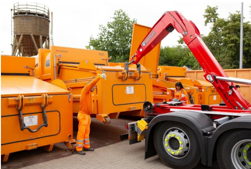
Abtransport voller Container