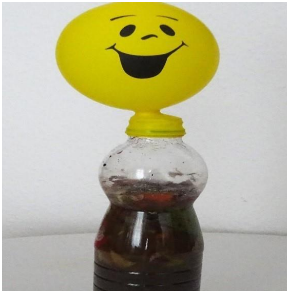
Selbstgebastelte Mini-Biogasanlage +

Ort: bei Ihnen vor Ort (Kita, Schule, Einrichtung) oder bei der Stadtreinigung Leipzig, Geithainer Straße 60