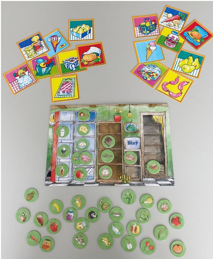
Spiele rund ums Thema Lebensmittel

Ort: bei Ihnen vor Ort (Kita, Schule, Einrichtung) oder bei der Stadtreinigung Leipzig, Geithainer Straße 60