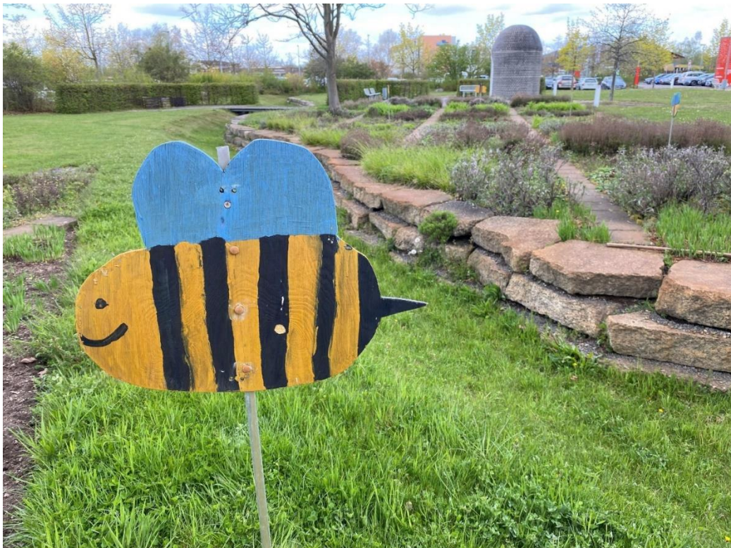
Insektenfreundlicher Infogarten der Stadtreinigung Leipzig

Hinweis: Vor Beginn findet eine Arbeitsschutzbelehrung statt und die Teilnehmer/-innen erhalten Arbeitsgeräte und Sicherheitswesten. In der Geithaier Straße 60 muss geschlossenes Schuhwerk getragen werden.