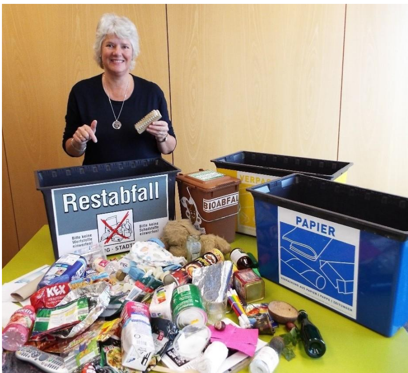
Abfalltrennung leicht gemacht

Ort: bei Ihnen vor Ort (Kita, Schule, Einrichtung) oder bei der Stadtreinigung Leipzig, Geithainer Straße 60