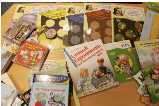
Bildungskiste mit Materialsammlung

Ort: Abholung bei der Stadtreinigung Leipzig, Geithainer Straße 60 (gegen Ausleihbestätigung durch Kita, Schule, Einrichtung)